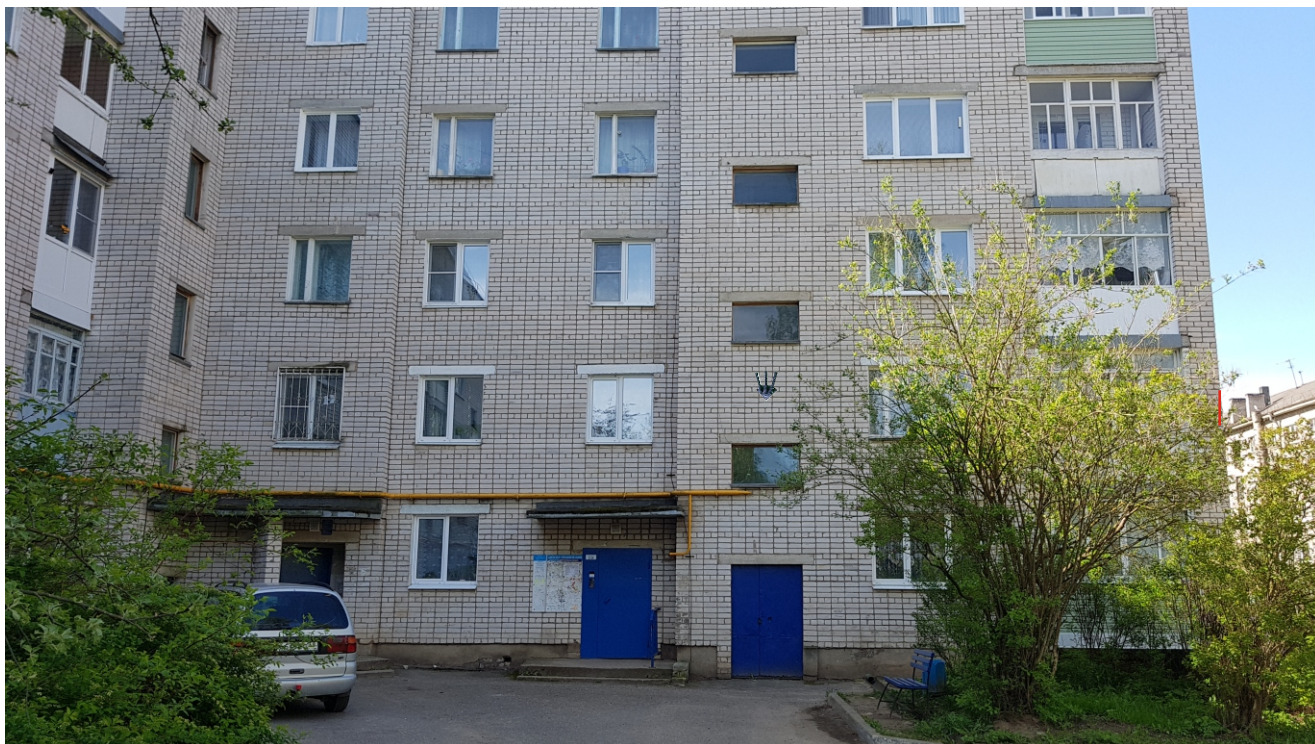
Схема места размещения флагштока на МКД Ленинградское шоссе, 42В, 6 подъезд

Схема места размещения флагштока на МКД Ленинградское шоссе, 42В, 1 подъезд Состояние фасада - удовлетворительное