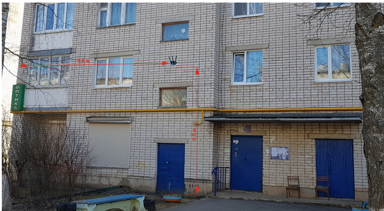
Схема места размещения флагштока на МКД Ленинградское шоссе, 42В, 6 подъезд

Описание 2 места расположения флагштока на МКД № 42В по Ленинградскому шоссе: