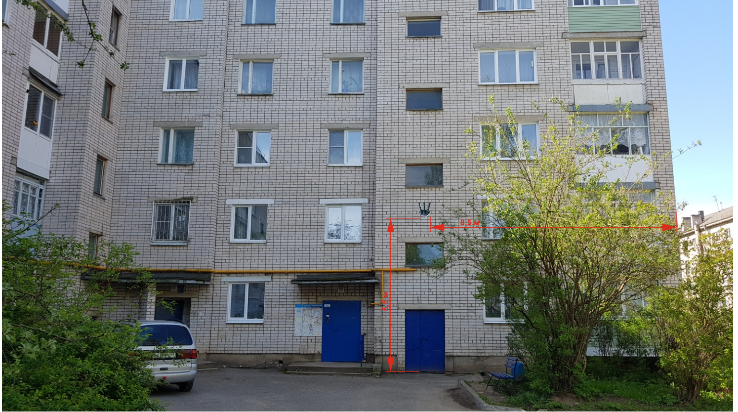
Схема места размещения флагштока на МКД Ленинградское шоссе, 42В, 1 подъезд

Описание 1 места расположения флагштока на МКД № 42В по Ленинградскому шоссе: На главной стороне фасада МКД № 42В по Ленинградскому шоссе, с правой стороны от входа в 1 подъезд дома, по середине между межлестничными оконными проемами 1,2 и 2,3 этажей дома, согласно следующих размеров указанных на схеме: